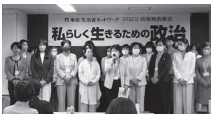
▲10/29 東京ネット2023政策発表会。来春行われる統一地方選に向けていよいよスタート！