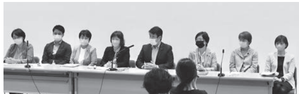
◀10月13日「英語スピーキングテストの都立高校入試への活用中止のための都議会議員連盟」発足の記者会見

都教委への10月17日のヒアリングでは、テスト実施の約ひと月前にもかかわらず、受験生に試験会場が知らされていない、会場の運営スタッフの人員確保ができていないなどの実態が明らかになりました。このような状況で公平・公正な試験が行えるのか、大きな不安が残ります。