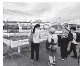
◀10/11 国立ネットメンバーで実踏中、矢川団地の交差点から矢川台の住宅地を望む。→★地点