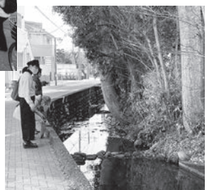
▶矢川に沿った緩やかな小道には、国立の自然がたくさん残されている→♥地点